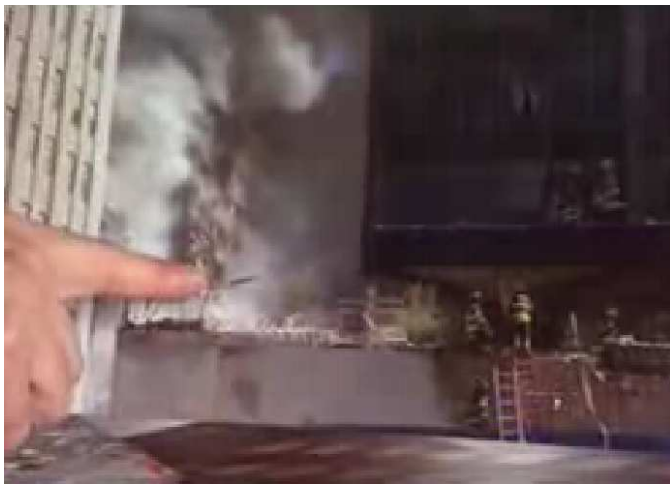
Fig. 3. Nouvelles photos montrant l'étendue des dommages

13. Interview de Steve Spak, photographe, qui relate un grand trou dans le building sur le côté Sud qui semblait venir du 12 e ou du 14 e étage. La photo est vague et n'apporte par grand chose. Il parle de « Smoke on a lot of floors. To me it's an indication of extremely heavy fires conditions and dangerous fire conditions ». La fumée à de nombreux étages ne veut pas dire grand chose (par définition, la fumée monte!). Le ton est très émotionnel (« extremely heavy fire », « dangerous »). Quelle que soit son expérience de photographe, cela reste le point de vue d'un photographe et non d'un ingénieur en structures qui sait par ailleurs pertinemment bien qu'un feu qui produit une épaisse fumée est un feu qui manque d'oxygène et qui n'est donc pas « extrême », et certainement pas extrêmement chaud.