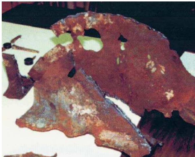
Fig. 6. Large flasque d'une poutre en acier du WTC7 avec érosion inhabituelle

aisément identifiable... La corrosion sévère et l'érosion subséquente des échantillons 1 et 2 sont un événement très peu commun. Aucune explication claire pour la source du soufre n'a été identifiée. »