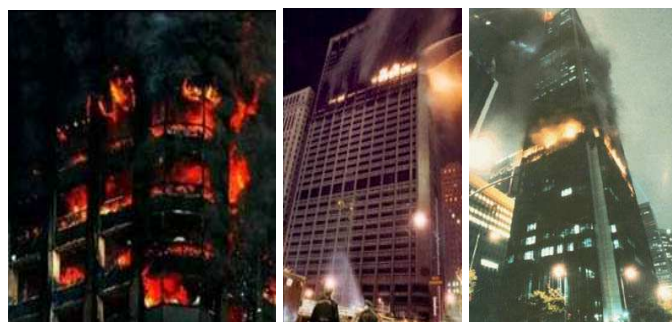
Fig. 7. Exemples d'incendies de gratte-ciels à structure d'acier (parmi une centaine d'autres) :

Parmi la centaine de gratte-ciels à structure en acier ayant subi des incendies importants, AUCUN ne s'est jamais effondré complètement sur lui-même, de façon symétrique, selon une accélération proche de celle de la pesanteur. Quand il y a effondrements, ceux-ci sont toujours graduels et partiels, ralentis par les structures sous-jacentes et ils n'engendrent JAMAIS la chute de l'ensemble de la structure. AUCUN effondrement d'un gratte-ciel à structure en acier en feu n'a jamais présenté les caractéristiques d'une démolition contrôlée comme observé dans le cas du WTC7.