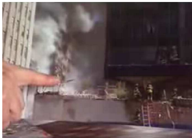
Fig. 3. Nouvelles photos montrant l'étendue des dommages

13. Interview de Steve Spak, photographe, qui relate un grand trou dans le building sur le côté Sud qui semblait venir du 12 e ou du 14 e étage. La photo est vague et n'apporte par grand chose. Il parle de « Smoke on a lot of floors. To me it's an indication of extremely heavy fires conditions and dangerous fire conditions ». La fumée à de nombreux étages ne veut pas dire grand chose (par définition, la fumée monte!). Le ton est très émotionnel (« extremely heavy fire », « dangerous »). Quelle que soit son expérience de photographe, cela reste le point de vue d'un photographe et non d'un ingénieur en structures qui sait par ailleurs pertinemment bien qu'un feu qui produit une épaisse fumée est un feu qui manque d'oxygène et qui n'est donc pas « extrême », et certainement pas extrêmement chaud.