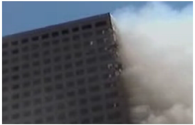
Fig. 5. Fumées, peu de flammes, dégâts limités

Quelle que soit la direction de la fumée – venant ou non de l'intérieur du WTC7 – on ne voit que très peu de flammes, la fumée est claire et les dommages restent limités.