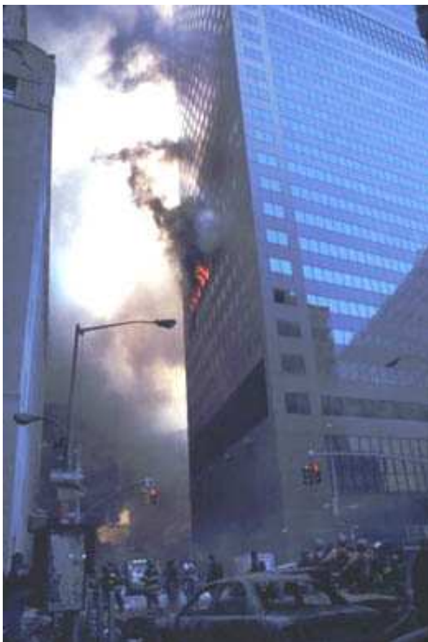
Fig. 2. Incendie au 6 e étage