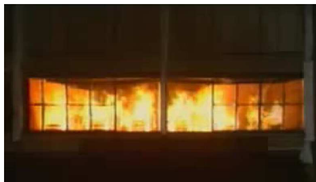
Fig. 1. Expériences de Cardington