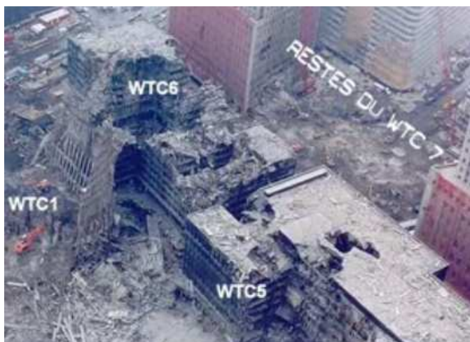
Fig. 8. Dégâts importants aux bâtiments WTC5 et WTC6, adjacents au WTC1, mais sans commune mesure avec le WTC7. De plus, ils sont toujours debout.

19. "Hard solid evidence from other buildings" (WTC5 et WTC 6). Ce témoignage est présenté comme un argument en faveur de l'effondrement dû au feu. Il n'est pas crédible pour plusieurs raisons. Rien n'indique que c'est bien le feu et non les débris du WTC1 et 2 qui ont provoqué ces dommages. On ne parle que de sections d'acier effondrées et non pas de l'ensemble de la structure comme pour le WTC7. Ces deux bâtiments, bien que fortement endommagés – ils sont plus près du WTC1 et 2 – sont bel et bien restés debout.