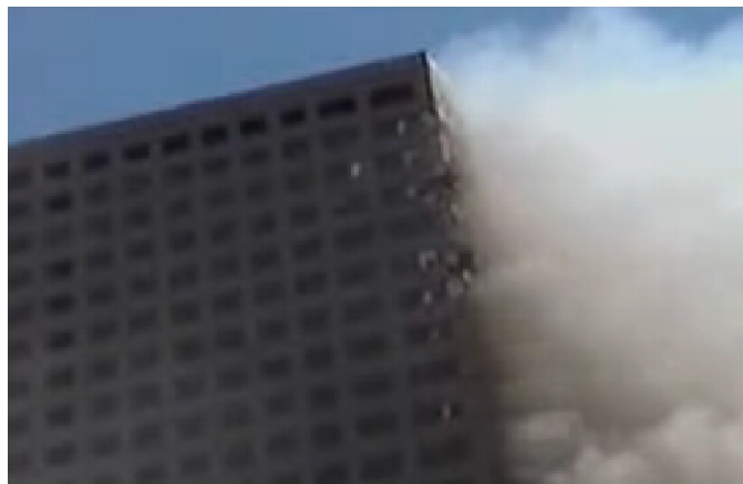
Fig. 5. Fumées, peu de flammes, dégâts limités

Quelle que soit la direction de la fumée – venant ou non de l'intérieur du WTC7 – on ne voit que très peu de flammes, la fumée est claire et les dommages restent limités.